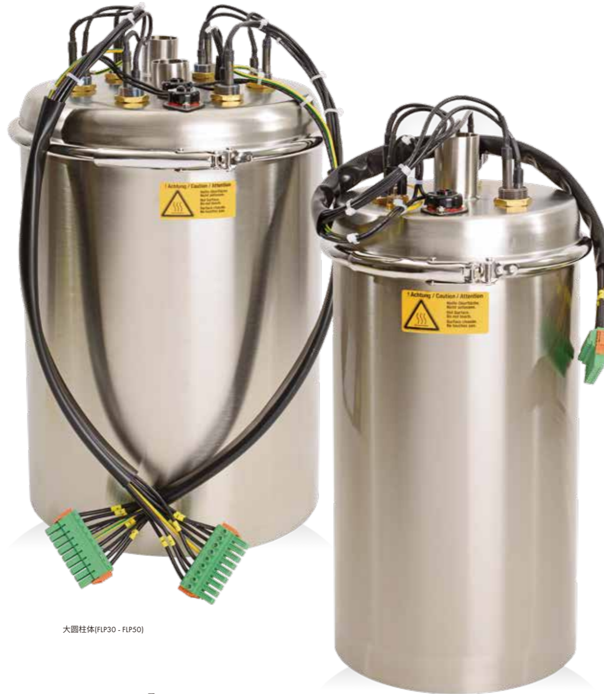
大圆柱体(FLP30 - FLP50)