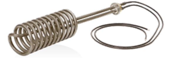
高度耐腐蚀合金的电阻型加热元件

蒙特FlexLine Plus和Process根据浸没式加热器原理，在不锈钢圆筒内借助1个、3个或6个电阻加热器对水进行加热。加热器由高度耐腐蚀的因科洛伊合金825 (铬镍钼合金)制成，保证了更强的耐用性。加热器的机械过热保护与电子比例液位控制共同提供双重保护。